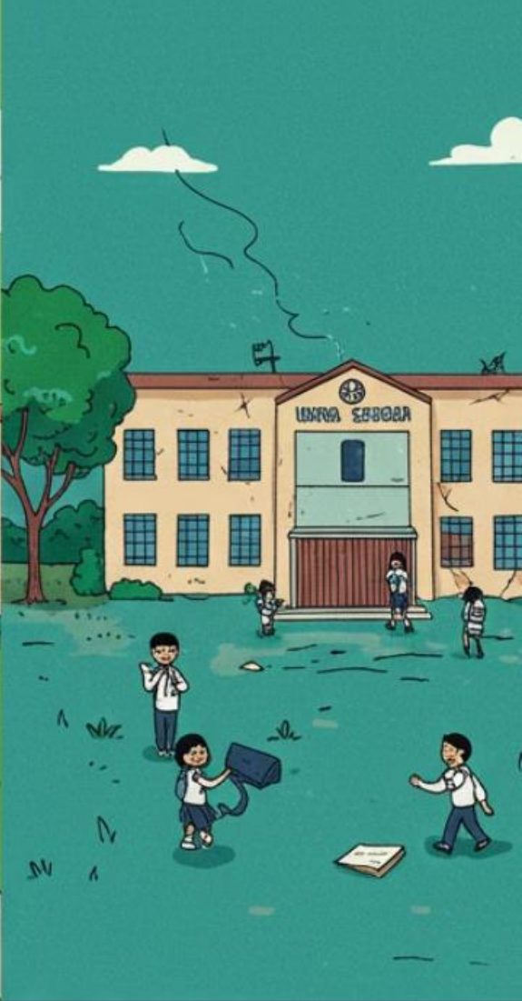
PRIVAT SOL BOYMICES (VS.) PUBLICA LATINO SHOWQUE