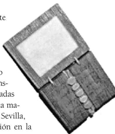
Tablilla de escritura romana.

Las aulas desaparecieron de la mayor parte del Imperio Romano durante la época de las invasiones bárbaras (siglo V al siglo VIII), debido a que fueron abandonadas y por la disminución de la asistencia de los menores a la escuela. Sin embargo, el grupo privilegiado siguió asistiendo a clases con instrucción católica, es decir, escuelas privadas dirigidas por maestros religiosos. Quizá la mayor prueba de esto fue el sabio Isidoro de Sevilla, quien escribió un libro sobre la educación en la España del siglo VII. Gracias a ese texto, llamado Las etimologías podemos saber que al iniciar la Edad Media en el aula católica, además de los tres saberes básicos latinos (leer, escribir y contar), se enseñó a cantar y a ejecutar música. 4 De esta forma, se sentaron las bases del quadri-