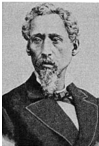
Ignacio Ramírez (1818-1879)

se redujera, por lo que el aula no necesitaba ser tan grande. Un máximo de cincuenta alumnos era el ideal. Esto implicó, además, que una escuela no podía tener un solo maestro, pues al dividir en seis los grados de enseñanza, se requerían de más maestros. En situaciones extremas, donde existían más alumnos de los esperados, podía utilizarse el sistema mixto, que consistía en combinar el sistema mutuo con el simultáneo. En este caso, el monitor sólo se dedicaba a la instrucción, es decir a la repetición de lo aprendido, mientras que el maestro siempre estaba avocado dentro del aula a la parte educativa, es decir, al aprendizaje de nuevas cosas.