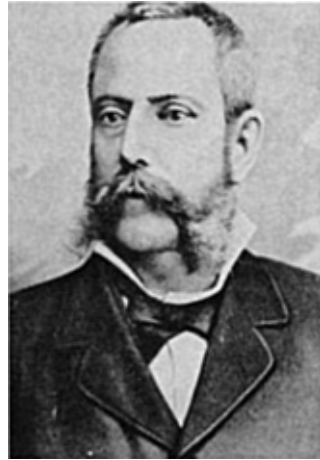
Gabino Barreda (1820-1881)

En este momento se inició el proyecto popular (1921-1940) de las llamadas escuelas de acción (la escuela rural, las misiones culturales, los centros culturales, las casas del pueblo y la educación socialista). Éstas implicaban aulas en las cuales se retomó parte del método objetivo, con espacio suficiente para llevar a objetos o imágenes de los mismos, con espacio suficiente para crear talleres, con la única finalidad del aprendizaje dentro de ellos y con maestros guía, que no iban a premiar o castigar a los alumnos (lo que implicaba que no debía haber dentro del aula el rincón de los castigados), estas diversas escuelas de la acción vivieron dos crisis durante su aplicación; en ambas estuvo implicada la in-