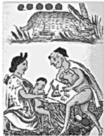
Educación Mexica.

En ese sentido, gran diferencia hubo entre el aula romana y la mexicana. La primera gran diferencia era que durante el dominio mexicano los estudios no se impartían en aulas privadas sino públicas, lo que hacía que el número de estudiantes fuera muy superior a las romanas. Otra diferencia radical fue que las mujeres estudiaban en las escuelas públicas, aunque no compartían el mismo lugar, sino por separado. A ellas, además de leer, escribir y sumar, se les enseñaba a cantar, a decir poemas religiosos o profanos. No era lo mismo la escuela pública para el niño común que la escuela del niño noble; la primera era llamada telpochcalli y la segunda calmécac , este último era donde la mayoría de los líderes políticos y religiosos se educaba. 3 El simple hecho de que la educación fuera pública durante el dominio mexicano nos hace suponer que el aula tenía más de doce alumnos. De tal modo, los métodos de enseñanza de los ro-