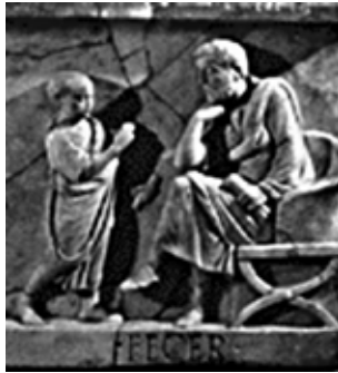
Profesor romano con alumno.

romana sólo llegaban a los estudios superiores los ciudadanos que habrían de gobernar al resto de los romanos, de tal modo que se les enseñaba a escribir discursos y se los preparaba para la vida pública en la enseñanza de la retórica y la oratoria.