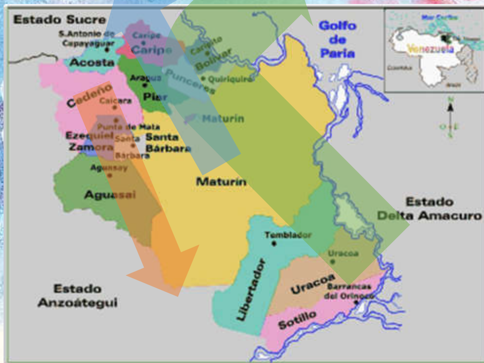
UBICACIÓN DE NUESTRO PROGRAMA EDUCACION INDIGENA