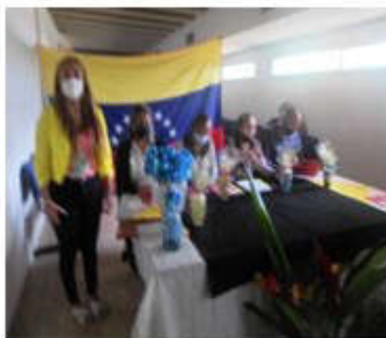
Presentaciones de Trabajo Especiales de Grado