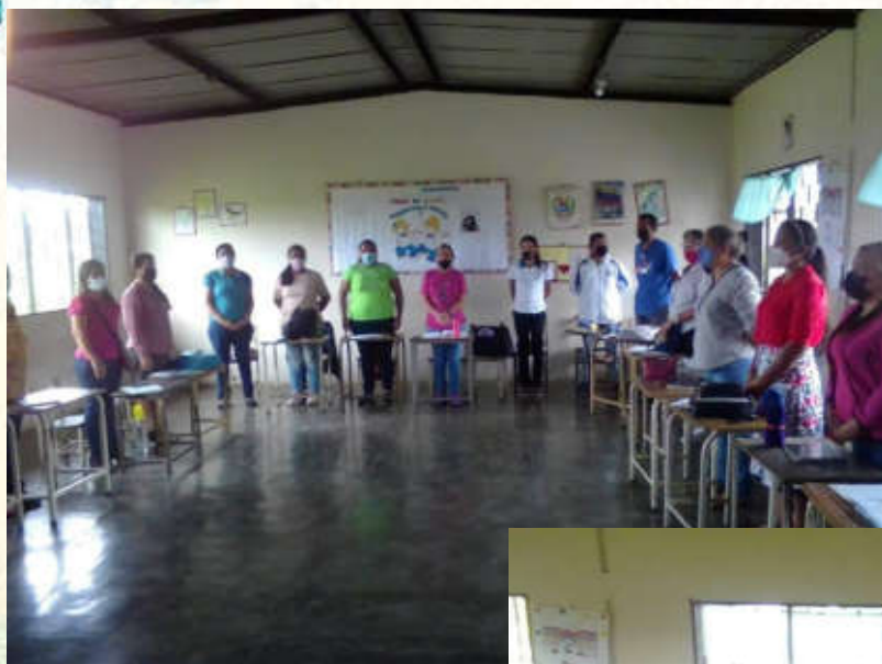
FORMACION DE LOS NIVELES DE CONCEPTUALIZACION DE LA LENGUA ESCRITA EN LA E.B. EL MEREYAL