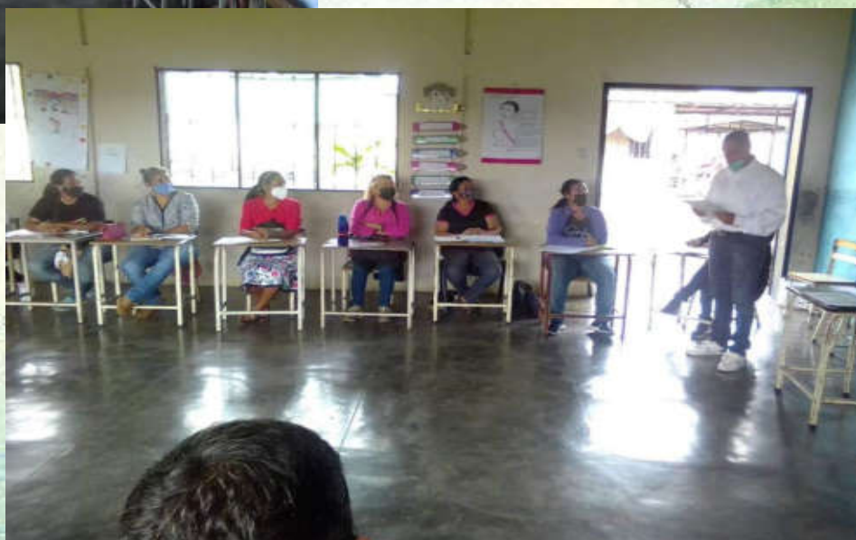
PARTICIPACIÓN DEL PERSONAL DIRECTIVO, SUPERVISOR DEL CIRCUITO, DOCENTES DE AULA REGULAR Y ESPECIALISTAS DE AULAS INTEGRADAS