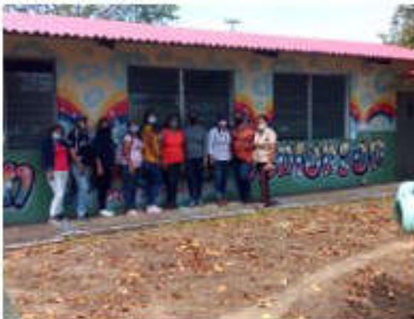
Actividad de Formación a las Participantes de Ezequiel Zamora T.E.G y T:G