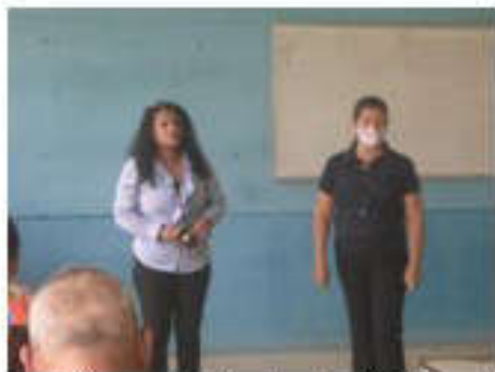
Presentación de los Tutores Regionales y Docentes Investigadores