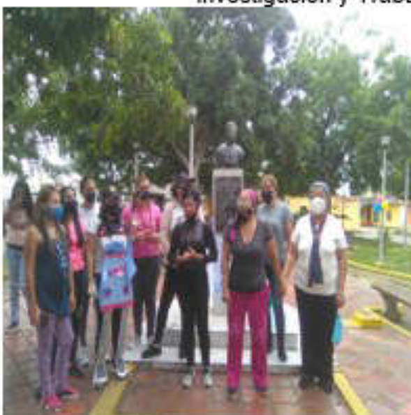
Actividad con los miembros de la Comunidad Barrio Obrero, Tutor Regional, Docentes Investigadores, Defensores Escolares, Representantes de Alcaldia, y Gobernación