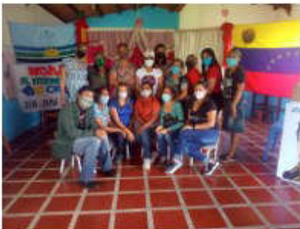
Orientaciones a participantes de Punceres para desarrollo de trabajos de investigación y Trabajo especial de grado