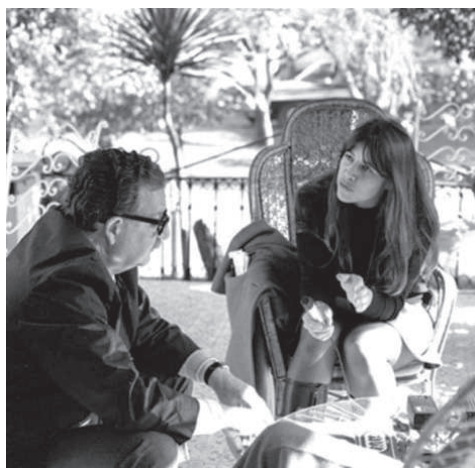
Salvador Allende Gossens conversa con Marta Harnecker del Semanario Chile Hoy , en los jardines de la casa de Tomás Moro (1972)