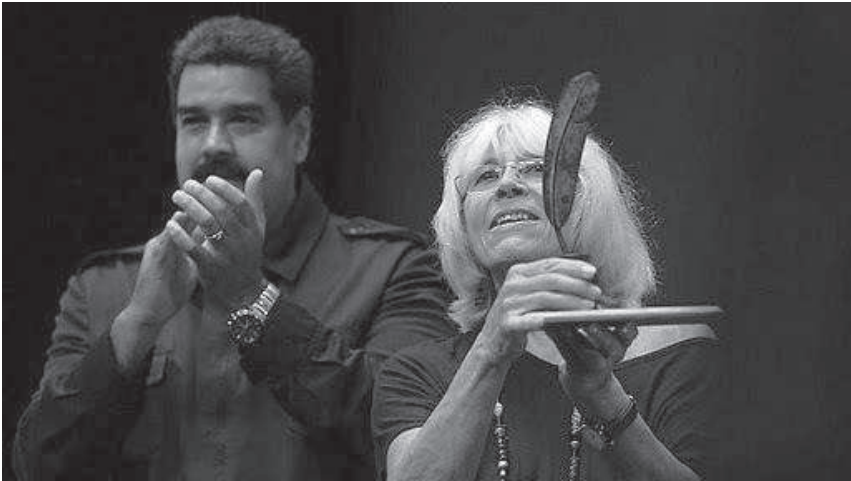
Marta Harnecker al recibir el Premio Libertador al Pensamiento Crítico (Caracas, 2014), junto al Presidente Nicolás Maduro