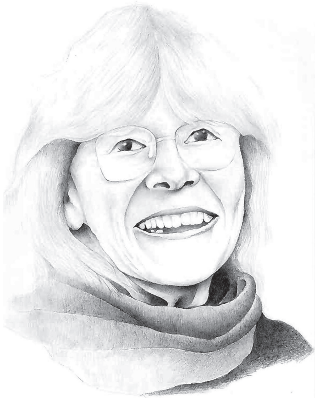
Dibujo a Lápiz de Hugo Mauro Germán, abril 2021