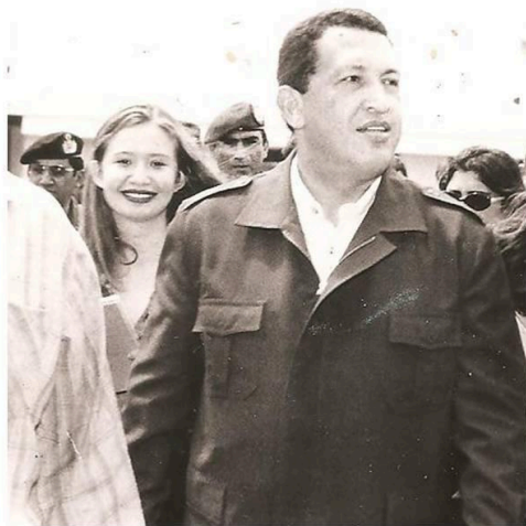
La Centellita. Proyecto Siete Pueblos, Siete Estrellas. Sur de Maturín. Nov. 1999 (*)