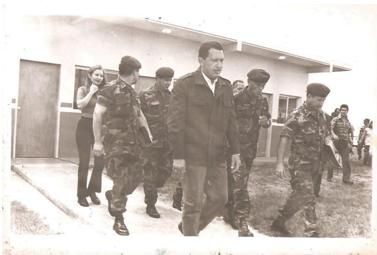
Salutación de fin de año en la Guarnición Militar, en el Fuerte Paramaconi. Maturín Dic. 1999