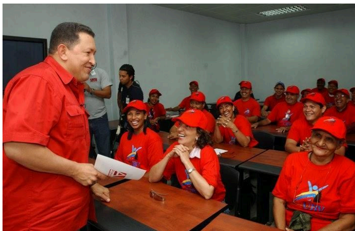
Inauguración de la UBV Sede Monagas, Maturín. Oct. 2005