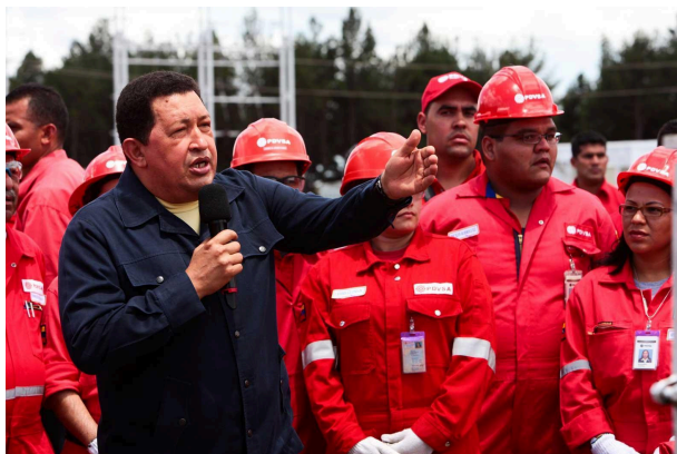
Faja petrolífera del Orinoco que hoy lleva su nombre. Sur de Monagas. Ago. 2006