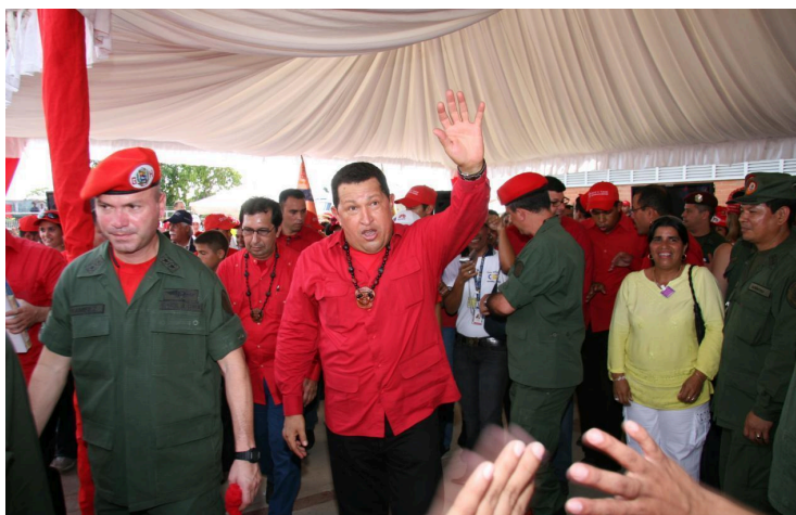
Inauguración del Liceo Salvador Allende, en la populosa parroquia Boquerón. Maturín. Sep. 2007