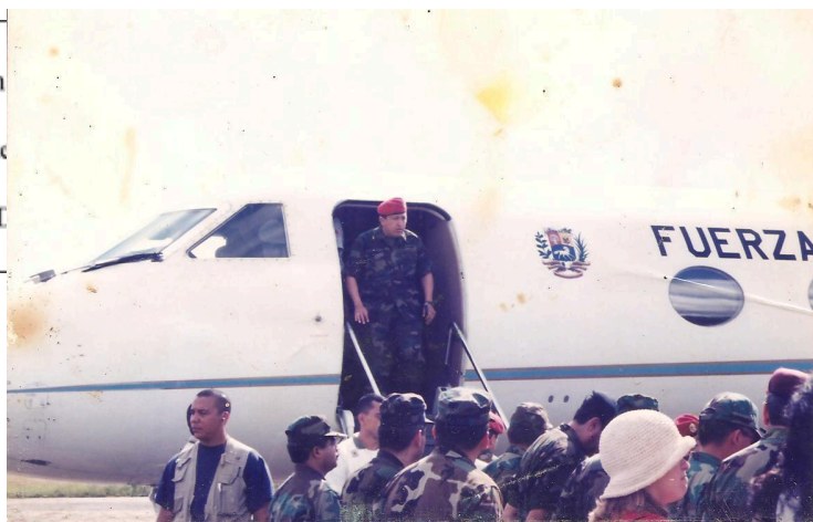
Salutación fin de año en Guarnición Militar, Fuerza Paramaoni. Maturín 1999