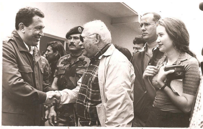
Arribo del comandante al Aeropuerto José Tadeo Monagas, para la instalación de una mega jornada médico asistencial del Plan Bolívar 2000. Maturín. Dic. 1999.